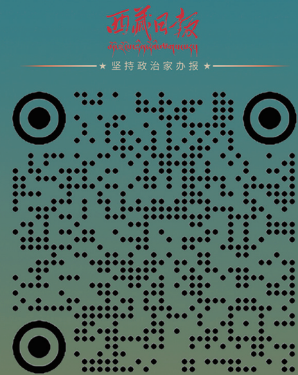
西藏发布微信公众号