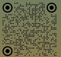
西藏商报微信公众号