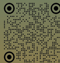
西藏日报微信公众号