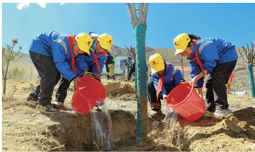
墨竹工卡县小学学生参与植树活动。

当日,就在全县上下积极投身义务植树、播撒绿色希望的同时,墨竹工卡县“十四五”国土绿化工作的亮眼成绩单同步出炉。最新统计数据显示,截至“十四五”末,全县森林草原覆盖率从“十三五”末74.18%稳步提升至78.22%,净增4个百分点,这意味着近十分之一的墨竹土地,在五年间被层层新绿覆盖,高原生态底色愈发厚重。五年来,该县累计投入6.44亿元,全力实施100035亩南北山等重点绿化工程,同时划定8.94万亩封育禁牧区,为高原脆弱生态