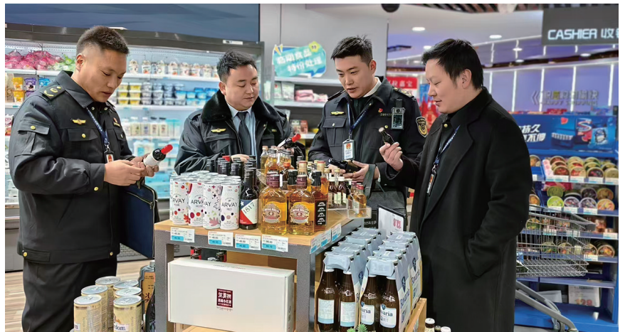
拉萨经开区市场监管局工作人员对商家食品进行抽查。

紧盯消费热点与高峰时段,拉萨经开区市场监管局常态长效开展旅游卖场联合集中整治,规范经营行为、保障产品质量、提振消费信心,持续净化市场环境。针对辖区特色商品,专项开展“散装长条肉干”等重点品类