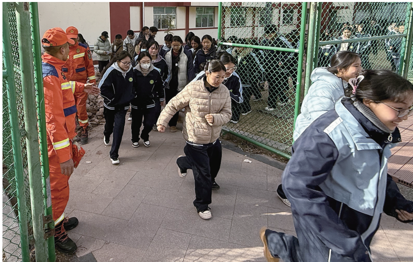
指战员现场组织开展地震应急疏散演练。

在装备展示区,地震装备、灭火装备、水域装备等器材整齐列装。指战员现场演示装备操作方法,详细讲解功能用途,并邀请师生近距离观摩、亲身体验,让大家直观感受消防装备技术原理与实战效能,在互动体验中加深对消防工作的理解与认同。