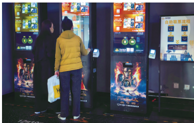
拉萨城关万达广场影城,市民正在取电影票。