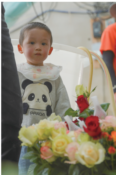
拉萨市民在达孜区现代农业产业园选购物品。