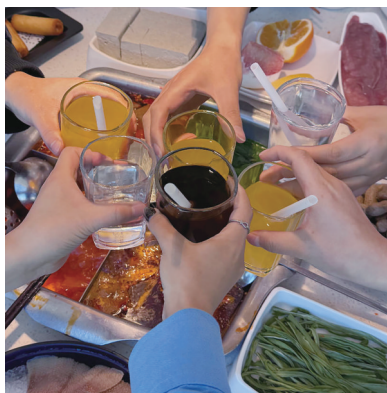
兴趣相投的朋友聚会。