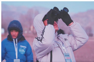
孩子们在观察黑颈鹤。