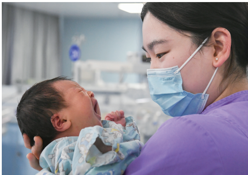
2026年1月1日,浙江省金华市人民医院新生儿科护士在护理新生儿。

凡是符合申领条件的婴幼儿,其申领人可通过支付宝、微信等平台“育儿补贴”小程序,以及婴幼儿户籍所在省份的政务服务平台育儿补贴申领专区线上申领,也可到婴幼儿户籍地乡镇、街道线下申请办理。