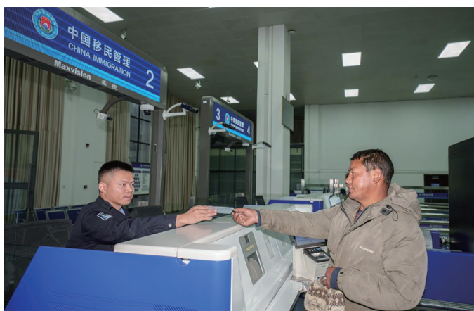
2026年1月1日,移民管理警察在中国吉隆口岸检查出境旅客证件。