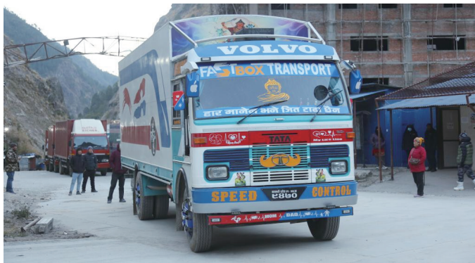
2026年1月1日,在尼泊尔热索瓦口岸,一辆卡车等待通过热索临时便桥进入中国吉隆口岸。