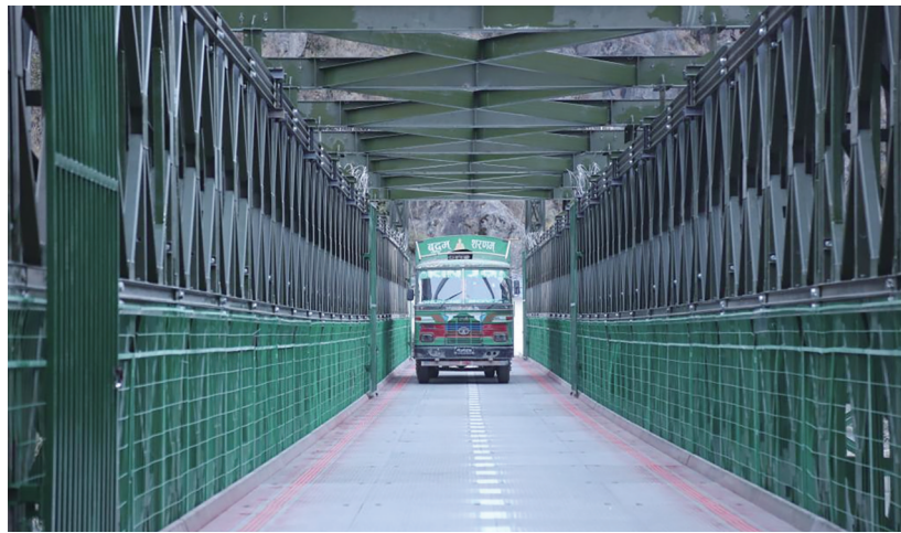
2026年1月1日,一辆尼泊尔卡车通过热索临时便桥驶向中国吉隆口岸。

新华社拉萨电(记者 蒋梦辰 张平)1月1日9时许,一辆辆尼泊尔货车经热索临时便桥从尼泊尔热索瓦口岸缓缓驶入西藏日喀则市吉隆口岸。在一旁的旅检大厅里,两国旅客也开始有序通关。这标志着中国吉隆—尼泊尔热索瓦口岸恢复通关。