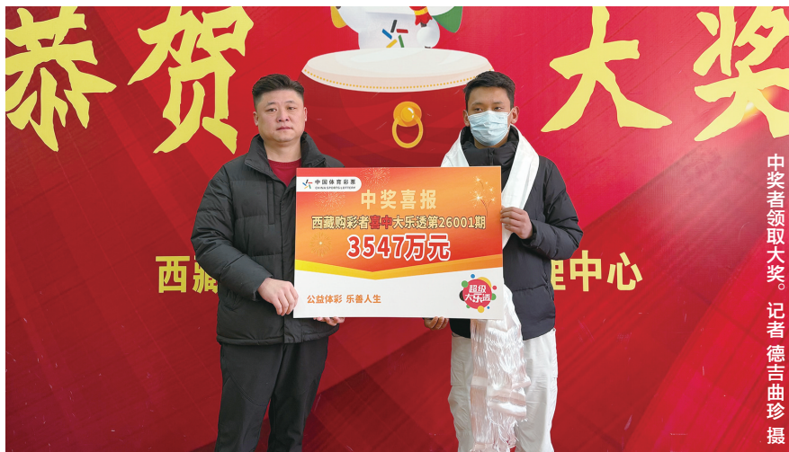
中奖者领取大奖。

西藏体彩中心相关负责人表示,体彩发行始终坚守公益初心,每一笔购彩资金都将用于支持体育事业和社会公益项目。此次千万大奖的诞生,既体现了彩票的随机性与公益性,也再次提醒公众,购彩应秉持“快乐购彩、理性为先”的理念,让公益与幸运相伴而行。