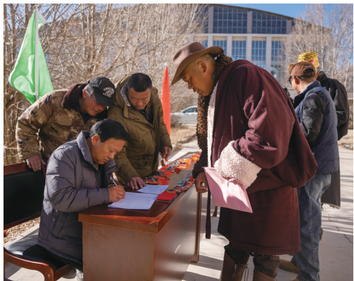
村民正在领取新房钥匙。