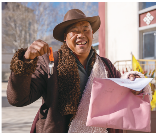
村民分到钥匙露出笑容。