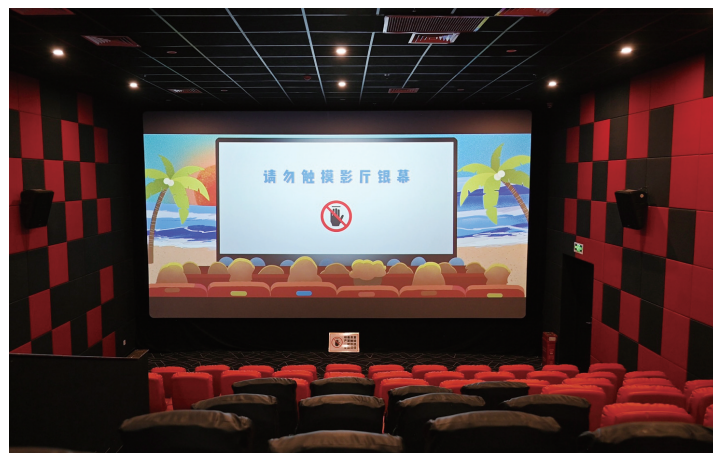
映前公益广告中包含“请勿触摸影院银幕”的提示。

国庆中秋放假期间,记者走访了拉萨多家影院,由于今年“国庆档”新片包含多部动画电影,带孩子一起看电影的观众较多。