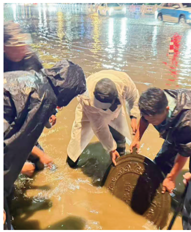
现场工作人员疏通雨水井。

8月26日晚,雄嘎社区工作人员在日常巡逻中发现,因强降雨天气,五岔路口、当热路与夺底路交叉路口的雨水井存在堵塞问题,导致路面出现大面积