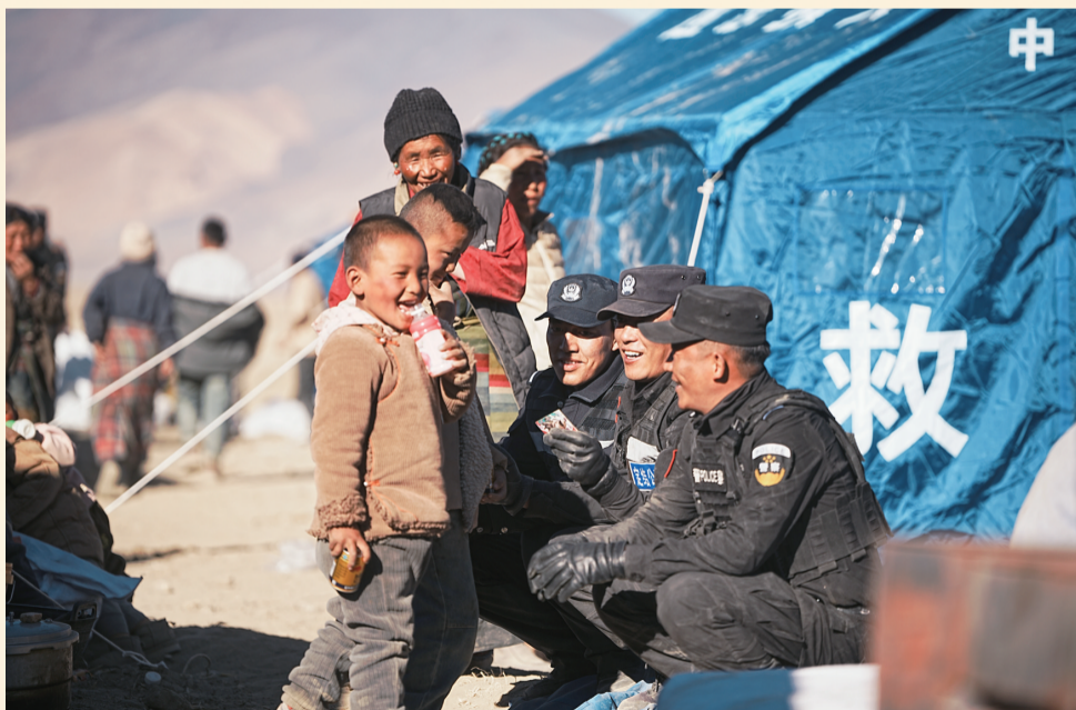
在日喀则市定日县措果乡吉措村安置点,小朋友和民警互动。

“‘四个创建’是自治区第十次党代会的最大理论成果,是当代马克思主义理论在西藏运用的典范。”赵建鹏说。