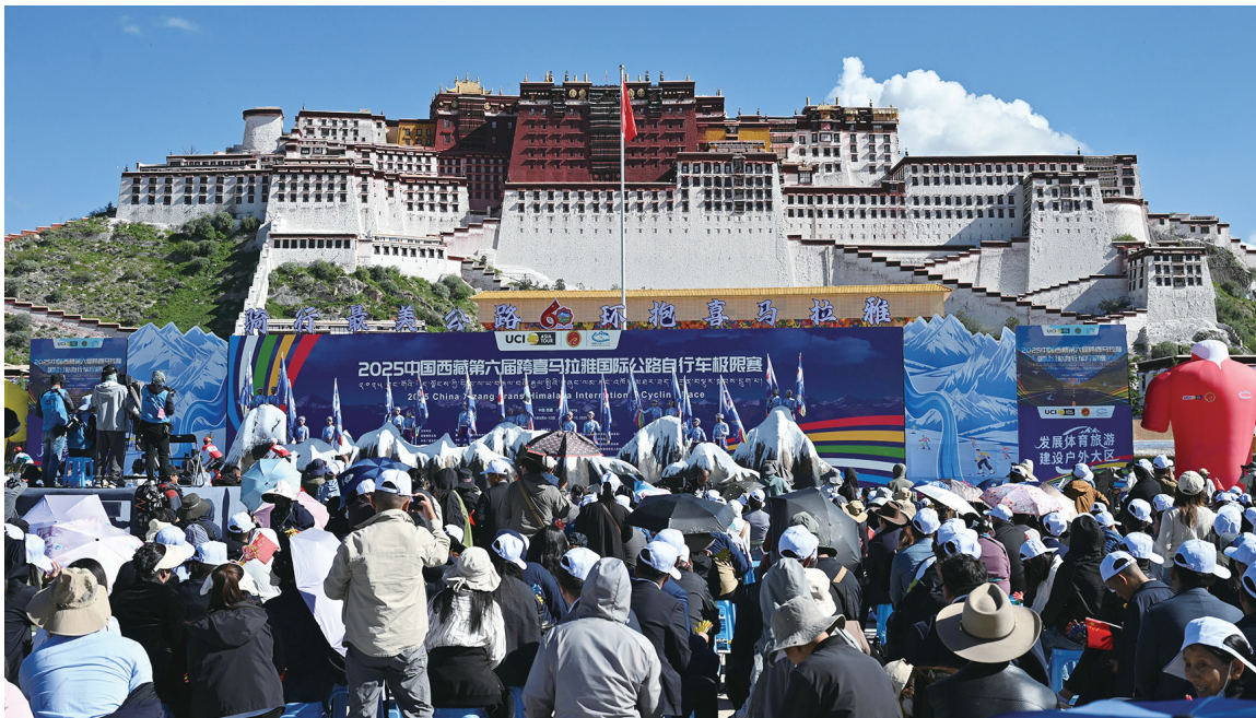
图为2025中国西藏第六届跨喜马拉雅国际公路自行车极限赛开幕式现场。