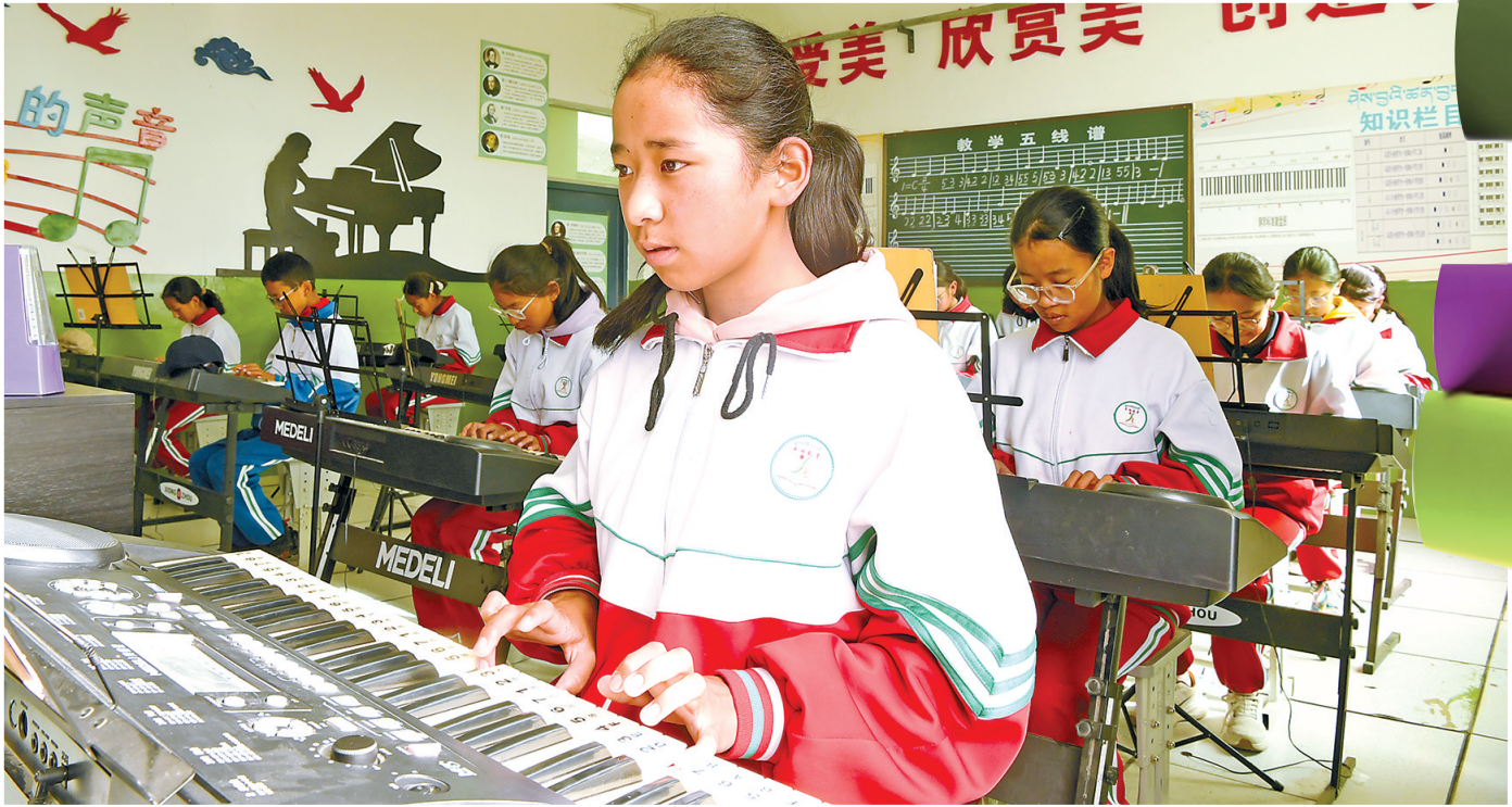
山南市浪卡子县中学的学生在音乐选修课上学习弹奏电子琴。

谈及家乡学校,扎西自豪万分:“现在不同了,学校成为当地最漂亮的地方。教室宽敞明亮,设施设备齐全,开齐开足了各科课程,家长也不用发愁孩子上了学、上不好学。现在的孩子太幸福了,希望他们好好读书,长大后建好家乡、报效祖国!”