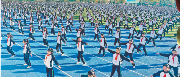
拉萨北京实验中学的学生在做课间操。

采访结束后,记者向多布杰表达了敬意和感谢。多布杰微笑着说:“我只是做了自己应该做的事情。”简单而深刻的一句话,再次彰显了多布杰对教育事业的热爱和执着。