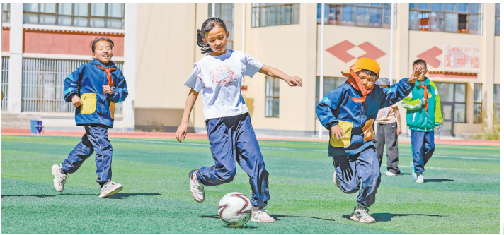
阿里地区札达县九年一贯制学校的学生在进行足球比赛。