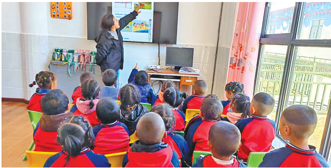
拉萨市当雄县乌玛乡郭尼村幼儿园的孩子们,在干净整洁的教室内学习安全教育知识。