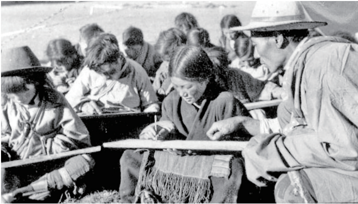
拉萨市当雄县民办帐篷小学课堂场景(资料图片)。