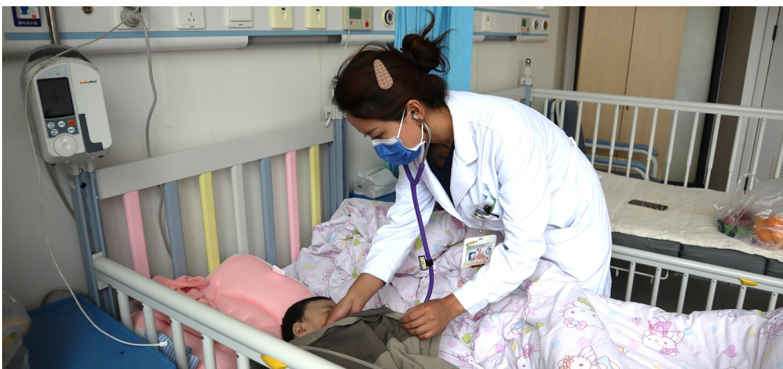
色珍正在为患儿听诊。