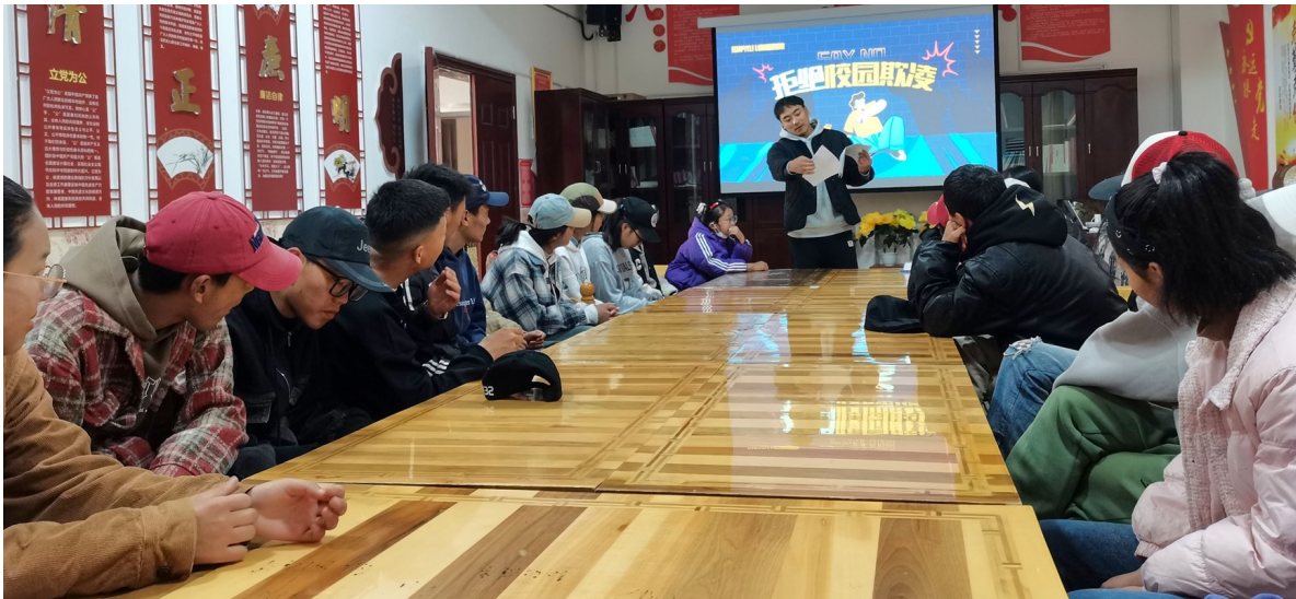
福利院孩子们在学习知识。

从受助者到助人者,他们的故事为院里的孩子们点亮了未来的可能,也传递着向上向善的正能量,激励更多人关注弱势群体、参与公益事业,共同营造充满爱的社会。这份用行动书写的美好,正吸引着越来越多的人加入关爱福利院孩子的行列,让爱的暖流持续涌动、生生不息。