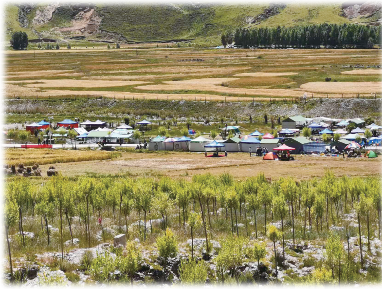
图为白纳林卡一角。西藏日报记者 黄志武 格桑伦珠 刘斯宇 拉巴桑姆 摄

朗追老人感慨道:“林卡让我们白纳更出名,更富裕。每年我还能分到几千元分红,作为老人,我感到非常满足和幸福。”