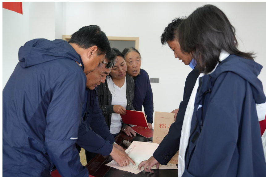
图为群众核对房产证信息。(资料图)

优化服务提升效能。自治区自然资源厅优化登记流程,实现不动产登记与办税线下“一窗办事”,将不动产登记流程从原来的7个合并减少至3个,一般登记、抵押登记业务办理时间压缩至5个工作日。同时,推广“跨省通办”“不动产登记电子证照”应用,拓展“互联网+不动产登记”服务模式;落实全区高效办成“不动产登记一件事”,深入推动政务服务提质增效。同时,为助力优化营商环境,加速项目建设落地,各地积极推行“交地即交证”“交房即交证”改革举措。截至目前,拉萨、林芝、日喀则、昌都市均实现国有建设用地使用权“交地即交证”,拉萨市、林芝市工布江达县开展“交房即交证”服务。