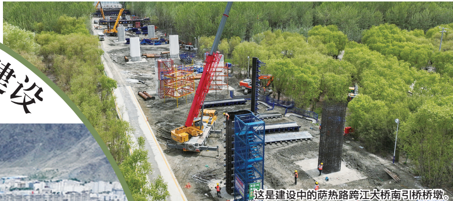
这是建设中的萨热路跨江大桥南引桥桥墩。