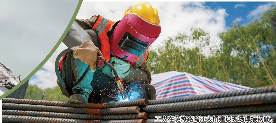
工人在萨热路跨江大桥建设现场焊接钢筋。