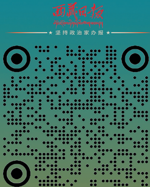
西藏发布微信公众号

听党话·感党恩·跟党走 全面的 及时的重要通知 总有一条信息 和TA需要的! 搜索热点国内国际 地市要闻 权威发布 活动招募 考录信息 要闻 等你发现... 分类信息 深度报道 吃喝玩乐 有料有趣 大美西藏 本地资讯 招聘求职 权威发布 民生 在线 重大项目建设 项目进展 深度报道 精彩瞬间 更多惊喜 扫码关注