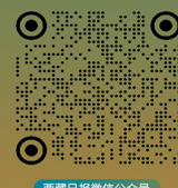
西藏日报微信公众号