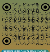
西藏日报藏文媒体微信公众号