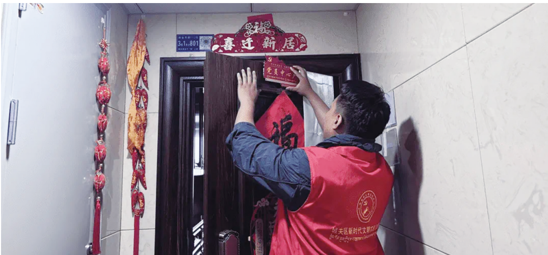
党的支部建在小区。