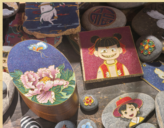
▲南吉合多杰工作室掌心大小的掐丝唐卡。