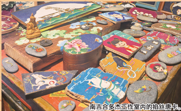
南吉合多杰工作室内的掐丝唐卡。