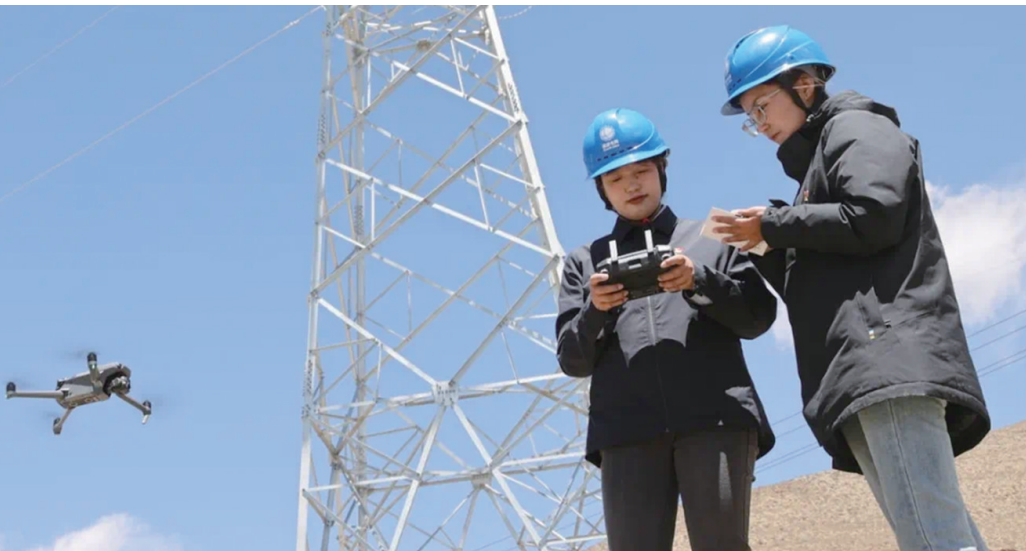
队员们在用无人机进行巡检。