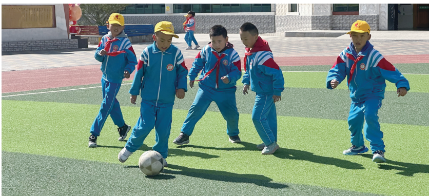
正在踢足球的学生们。