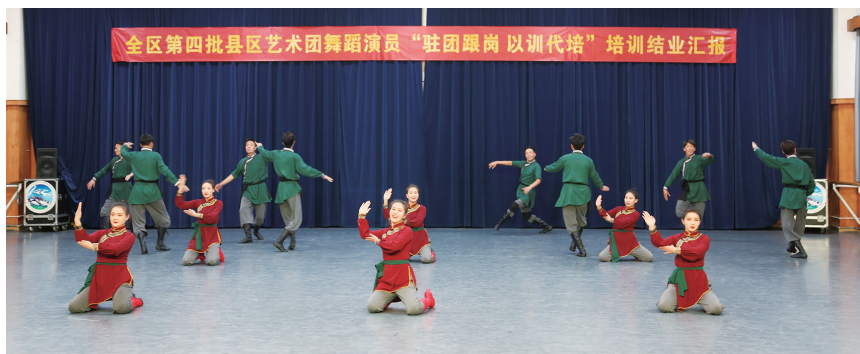
第四批舞蹈演员培训结业。

本报讯(记者 赵越)近日,西藏自治区歌舞团面向林芝市、昌都市举办的全区第四批县区艺术团舞蹈演员“驻团跟岗、以训代培”培训顺利结业。结业汇报演出中,学员们展示了基本功训练、中国民族民间舞基础训练及剧目表演。