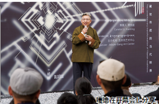
嘎德在开幕式上发言