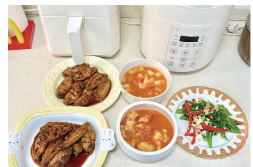
潘女士为客户做的菜品。

下班后,在广州工作的“95后”彤彤(化名)直奔客户家中做晚餐。客户是她的小红书上发帖自荐上门做菜后联系上的。