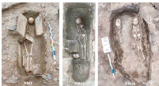
玛不错第一期典型墓葬。

六十载栉风沐雨,西藏考古始终与时代同频共振。从上世纪六十年代文物调查叩响高原文明之门,到2024年康玛县玛不错遗址荣获全国“十大考古新发现”,一代代考古人在平均海拔4000米的雪线之上,以手铲为笔、以大地为卷,书写着中华文明多元一体的西藏篇章。西藏自治区文物局党组书记赵兴邦介绍,2025年,西藏自治区文物局以“四大课题”为经纬,织就西藏考古工作的学术图谱。