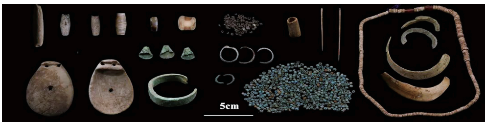
玛不错第一期遗物(石质、骨质、金属装饰品以及骨针、滑石珠、红玉髓、玻璃珠等)。