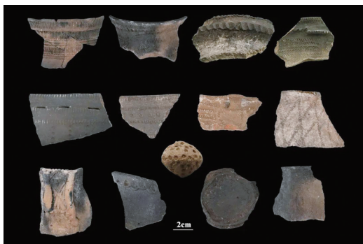
玛不错第一期陶器组合。