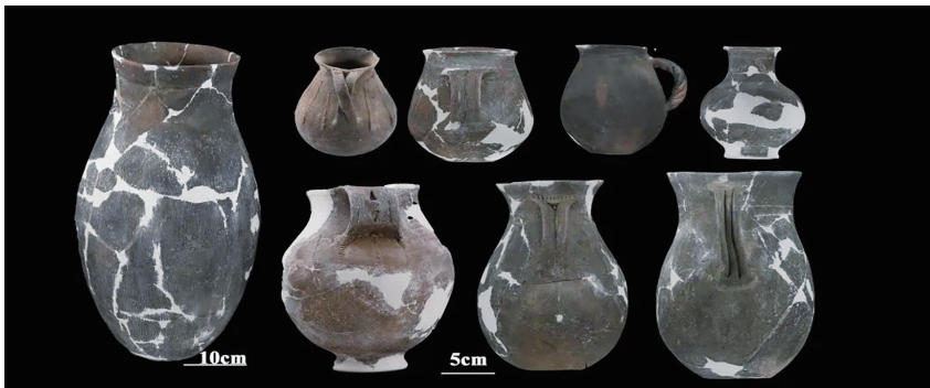
玛不错第二期典型陶器。