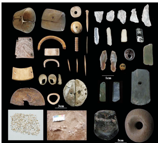
玛不错第一期典型骨器和石器。