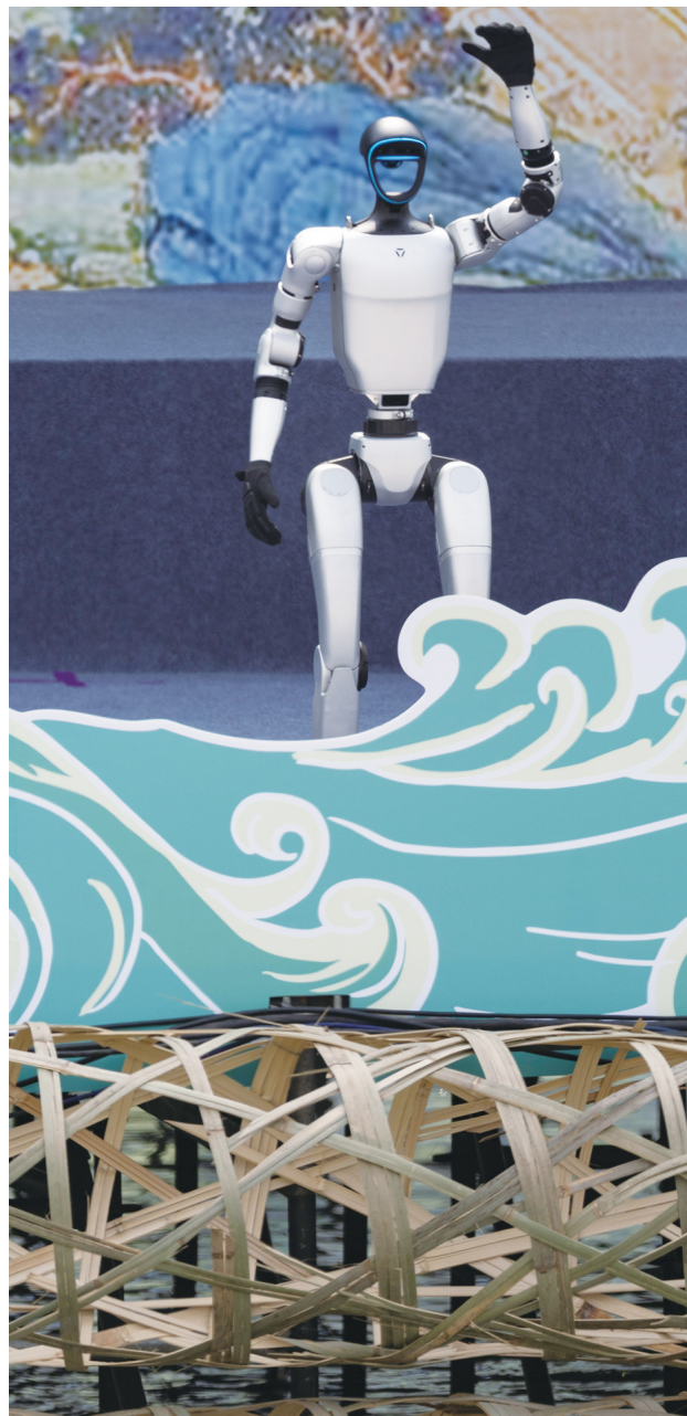
4月4日,在2025都江堰放水节上,人形机器人当起主持人。

“发展养老机器人,也不能忽视子女对老人的陪伴。亲情关系是机器无法替代的。过度依赖养老机器人,可能导致老人心理健康问题。要将技术与人文关怀相结合,让老年人既能享受科技带来的便利,又能感受到人性温暖。”鞍山师范学院应用技术学院副院长魏红敏说。