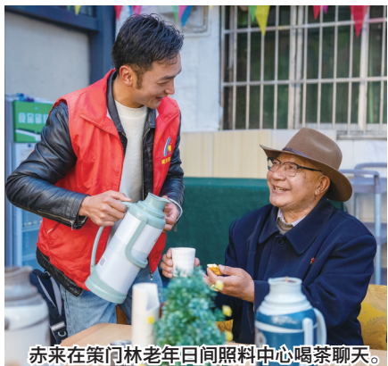
赤来在策门林老年日间照料中心喝茶聊天。

今年西藏自治区政府工作报告中提出:“2024年实施保障性安居工程395万套,改造老旧小区118个。2025年新建续建保障性安居工程179万套,改造老旧小区70个。”一直以来,我区始终坚持以人民为中心的发展思想,努力谱写“安得广厦千万间”的美丽蓝图,让越来越多的群众享受到城市发展的红利,实现了安居梦。