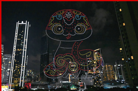
1月25日，在马来西亚吉隆坡举行的2025年“欢乐春节”全球启动仪式前，无人机展示蛇年主题图案。

“春节的色彩、声音和情感超越了语言和地域的界限，成为国际文化交流的重要纽带。”巴基斯坦智库全球丝绸之路研究联盟创始主席泽米尔·阿万说，“世界上越来越多地方参与春节庆祝活动，这种全球性的热情反映出中国文化的巨大吸引力。”