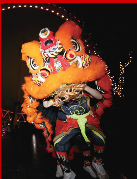
1月28日，在英国首都伦敦，演员在亮起红色灯光的地标建筑“伦敦眼”前表演舞狮。