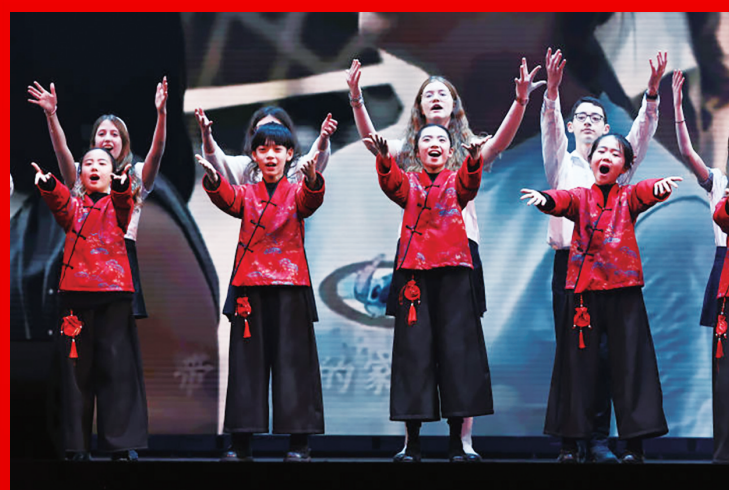
1月20日，在法国巴黎举行的“金蛇献瑞”巴黎春节联欢晚会上，中法青少年合唱《歌声与微笑》。