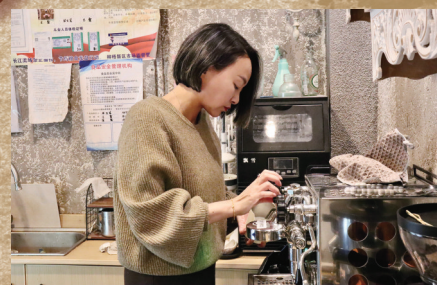
正在做咖啡的板栗。