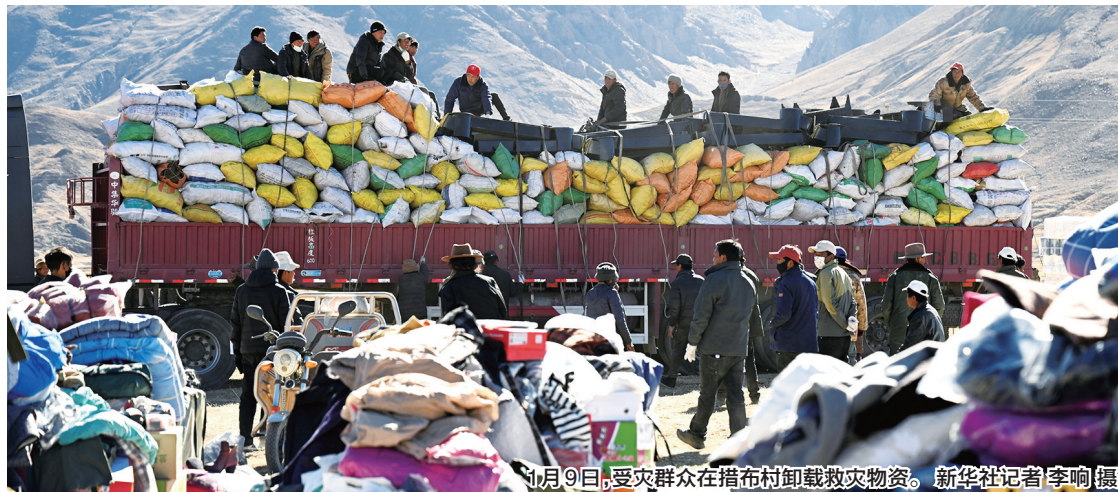
1月9日,受灾群众在措布村卸载救灾物资。