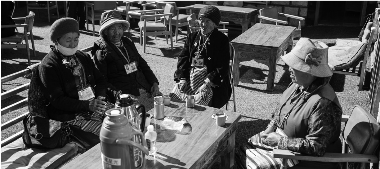
拉萨某日间照料中心的老人。