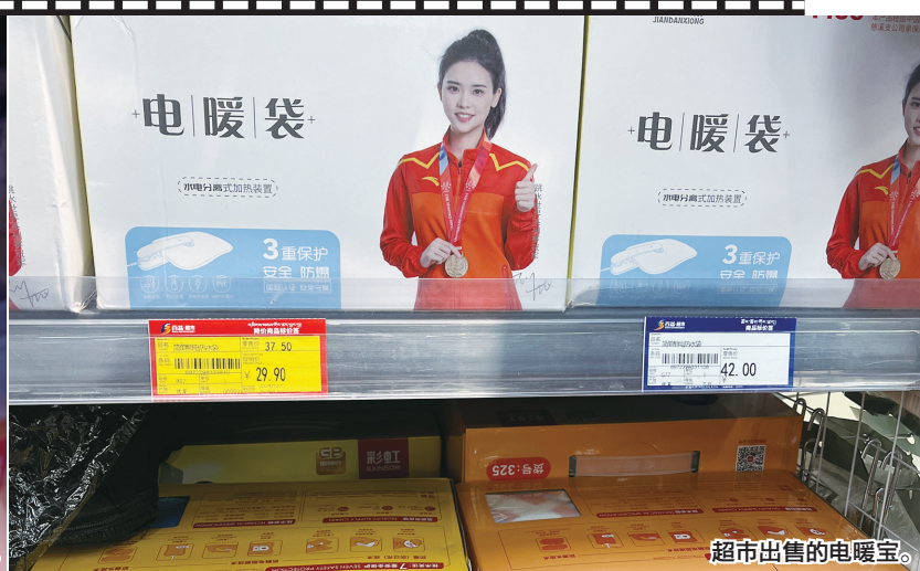
超市出售的电暖宝。