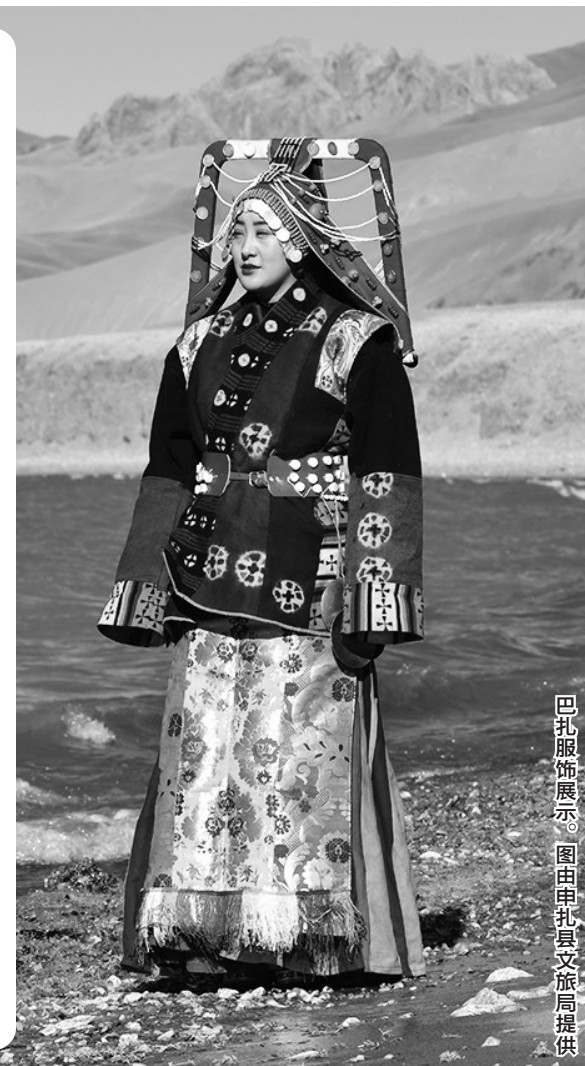
巴扎服饰展示。