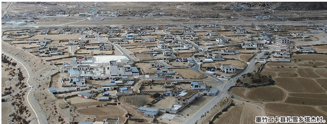
墨竹工卡县扎雪乡塔杰村。