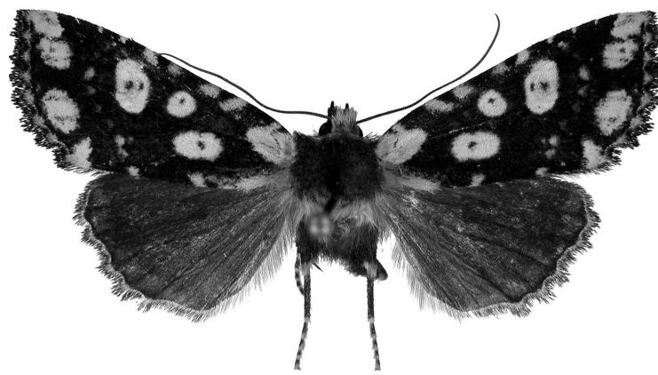
墨脱高夜蛾的模式标本。