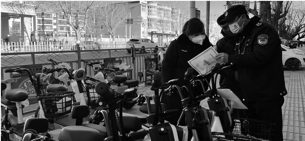
市场监管局工作人员对电动自行车进行检查。

记者了解到,2024年年初,拉萨市市场监管局结合经济社会发展需要、产品质量安全形势、产业发展状况,印发《重点工业产品质量安全监管目录(2024年版)》,聚焦生产领域和流通领域产品质量,合理确定监管重点、监管措施、监管频次,确保监管工作取得实效,产品质量不断提升。