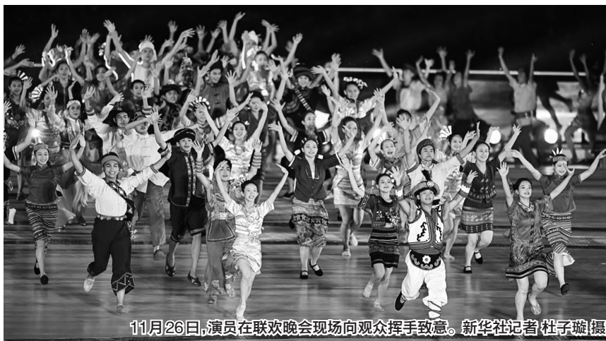
11月26日,演员在联欢晚会现场向观众挥手致意。新华社记者 杜子璇 摄

本届运动会的秋干项目,已经从小众运动走向“网红”项目。在吉林省延边朝鲜族自治州的朝鲜族民俗园传统体育运动区,每逢节假日,身着朝鲜族服饰的表演人员都会进行荡秋千表演。暑假期间,这里成为游