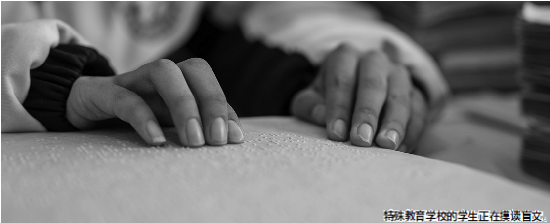
特殊教育学校的学生正在摸读盲文。