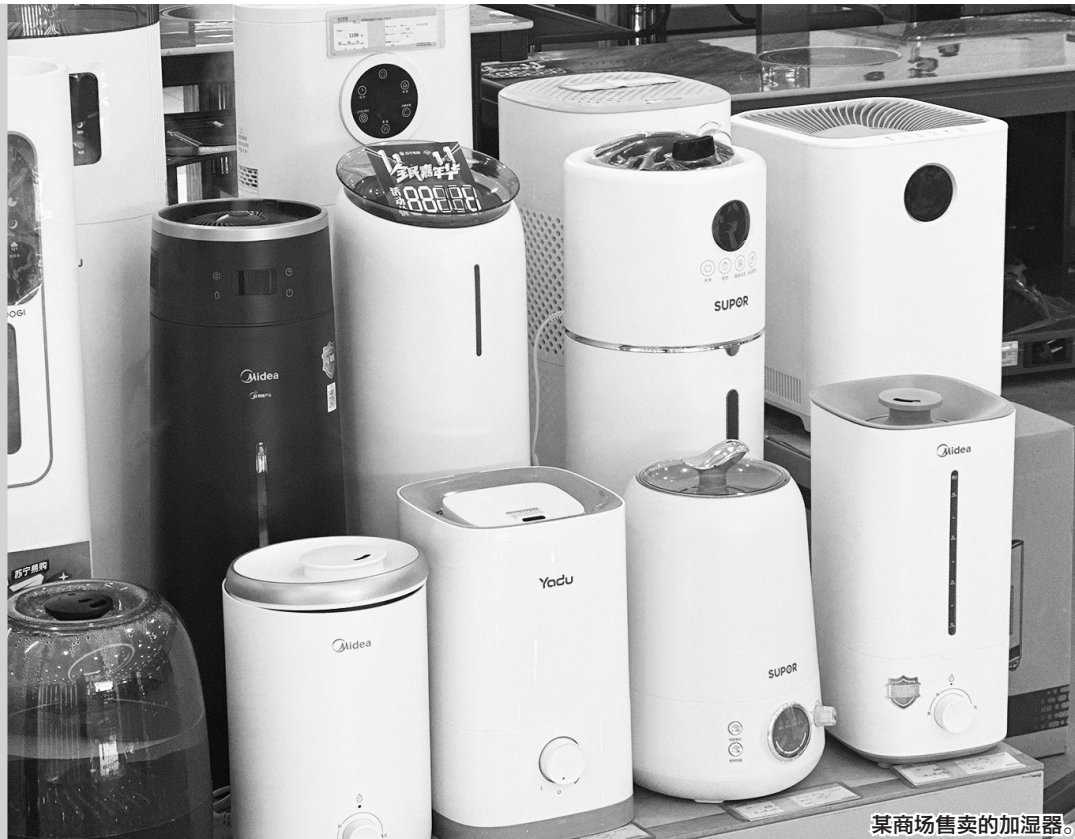
某商场售卖的加湿器。