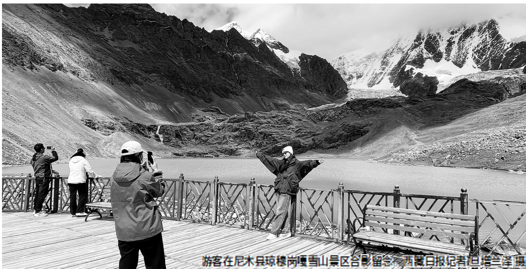
游客在尼木县琼博岗雪山景区合影留念

今年以来,我区大力实施文艺精品工程、特色文化和旅游产业培育工程等九大工程,有力推动文旅工作深入开展。今年截至9月,全区文化产业产值已达88.64亿元,同比增长22%。同时,全区累计接待国内外游客5728.56万人次,同比增长15.34%,实现旅游总花费670.55亿元,同比增长151.4%。