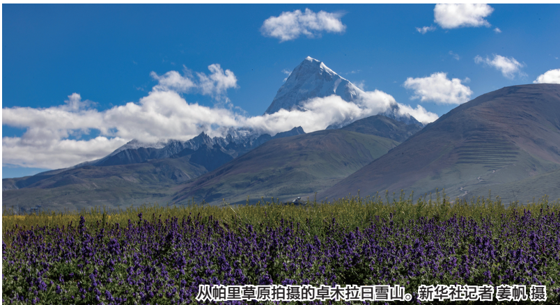
从帕里草原拍摄的卓木拉日雪山。