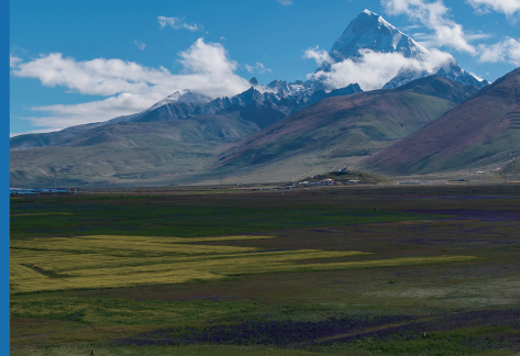
从帕里草原拍摄的卓木拉日雪山。

线路二 Day1:日喀则—亚东沟 Day2:亚东沟—岗巴边境第一村—秘境陈塘 Day3:陈塘沟—郭加乡—珠峰游客大本营—珠峰小镇 Day4:珠峰小镇—日喀则