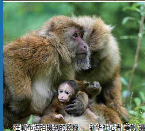
在勒布沟拍摄到的猕猴。