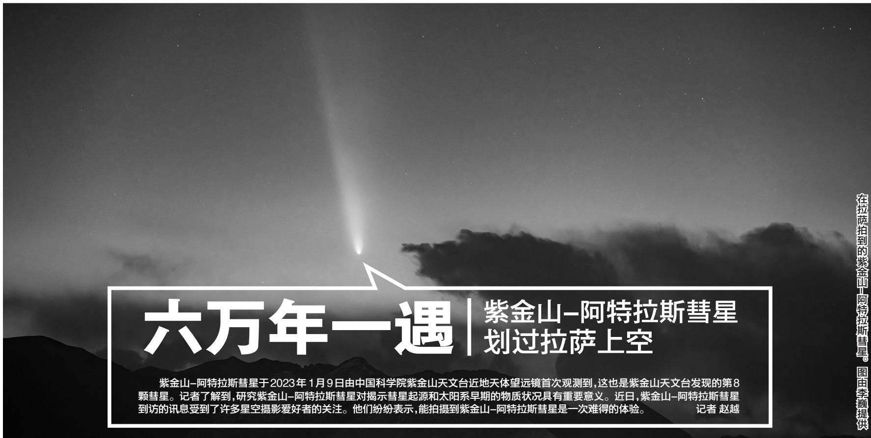
在拉萨拍到的紫金山-阿特拉斯彗星。