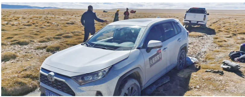
救援现场。

临别时,司机怀着感激的心对民警说:“在无人区遇到这样的突发情况,幸亏有你们,要不然我们真的不知道该怎么办,谢谢你们!”一件小小的暖心事,一句暖暖的感谢话语,是警民“鱼水情深”的最好见证,磁石乡派出所将继续用自己的“辛勤指数”,为人民群众增添安全感和幸福感。