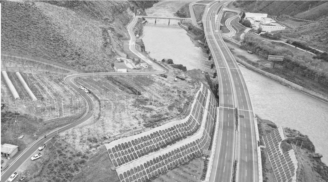
昌都市卡若区城关镇环行政村萨迦自然村(农村公路与高速)。

这十年,是农村公路管养持续升级,农牧区出行条件大为改善的十年。农村公路管理养护体制改革持续深化,农村公路养护补助资金标准大幅提高,试点引领推进改革各项政策措施落实落地,全区已成立97家养护公司。农村公路养护生产模式日益完善,路况自动化检测稳步推进,养护科学决策体系初步建立,路产路权保护逐步到位,应急管理机制逐步健全,路域环境持续优化,管养主体责任进一步落实。截至2023年底,全区农村公路列养率保持100%,农村公路实现“有路必养”,一条条“畅安舒美”的农村公路正成为一道道美丽风景线,助推形成了一大批宜居、宜业、宜游的特色小镇。