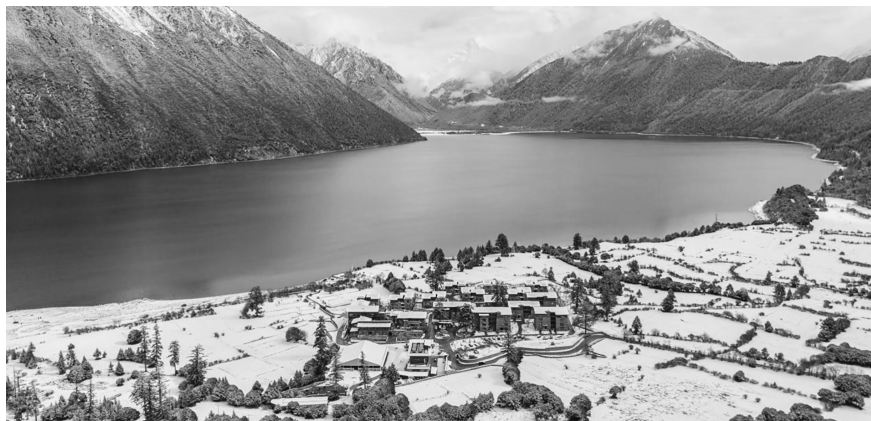
冬日巴松措。

商报讯(通讯员 李腾 记者 张琳)古城拉萨,阳光明媚暖人;南迦巴瓦,夕阳映照金山;鲁朗小镇,林海银装素裹;纳木错,湖面冰封玉砌……冬游西藏,每处风景都是“限定”款。记者从自治区文化和旅游厅了解到,10月18日,向光向上 冬游西藏——2024冬游西藏启动仪式将在西藏大剧院隆重举行。