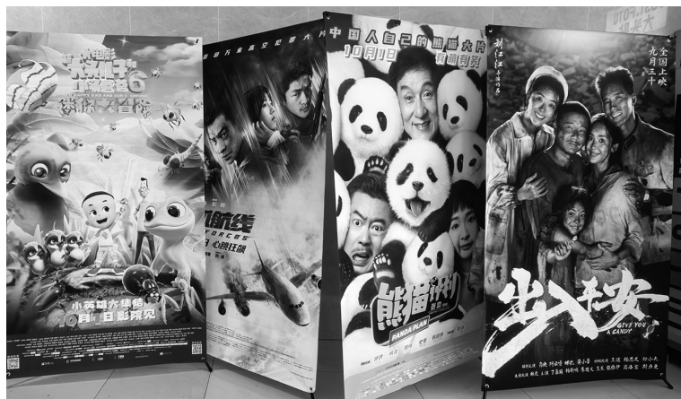
“国庆档”电影宣传展板。