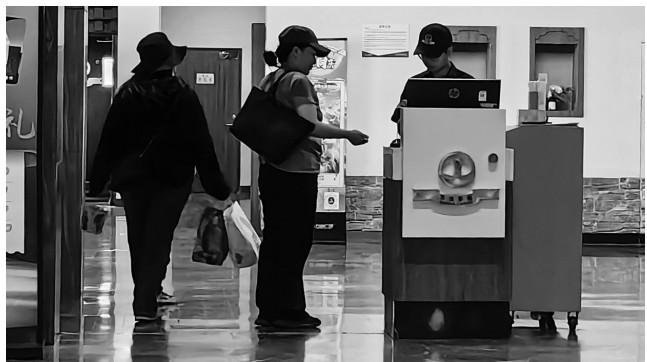
市民正在检票入场观影。