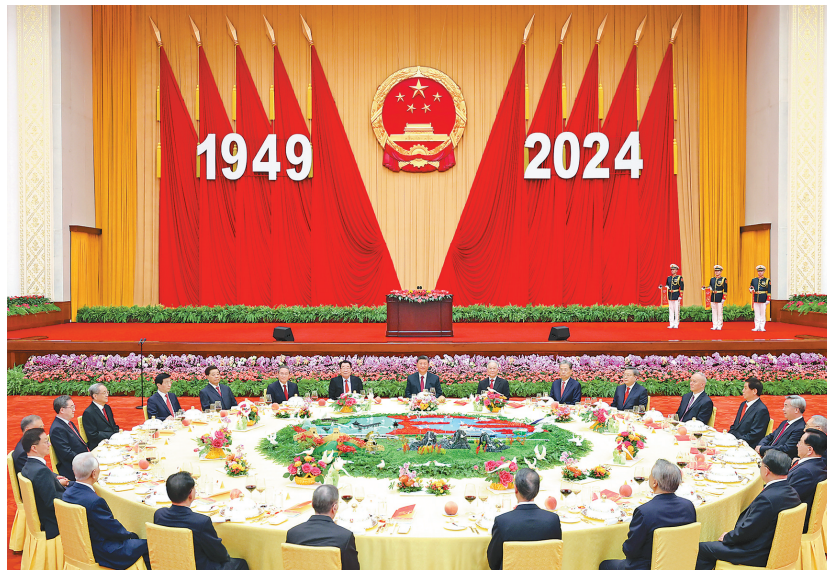
9月30日晚,庆祝中华人民共和国成立75周年招待会在北京人民大会堂隆重举行。习近平、李强、赵乐际、王沪宁、蔡奇、丁薛祥、李希、韩正等党和国家领导人与约3000名中外人士欢聚一堂,共庆新中国75周年华诞。

新华社北京9月30日电 庆祝中华人民共和国成立75周年招待会30日晚在人民大会堂隆重举行。中共中央总书记、国家主席、中央军委主席习近平出席招待会并发表重要讲话。他强调,中华人民共和国成立75年来,我们党团结带领全国各族人民不懈奋斗,创造了经济快速发展和社会长期稳定两大奇迹,中国发生沧海桑田的巨大变化,中华民族伟大复兴进入了不可逆转的历史进程。新时代新征程,中国人民必将创造出新的更大辉煌,必将为人类和平发展的崇高事业作出新的更大贡献。