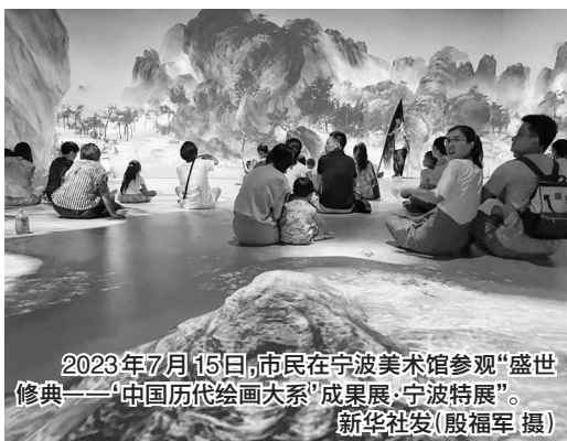
2023年7月15日,市民在宁波美术馆参观“盛世修典——‘中国历代绘画大系’成果展·宁波特展”。

“书藏古今,港通天下”是宁波的城市形象主题口号。在宁波市中心,茂林修竹间掩映着一幢重檐硬山顶的二层砖木结构建筑,它就是中国现存最古老的私家藏书楼——天一阁。