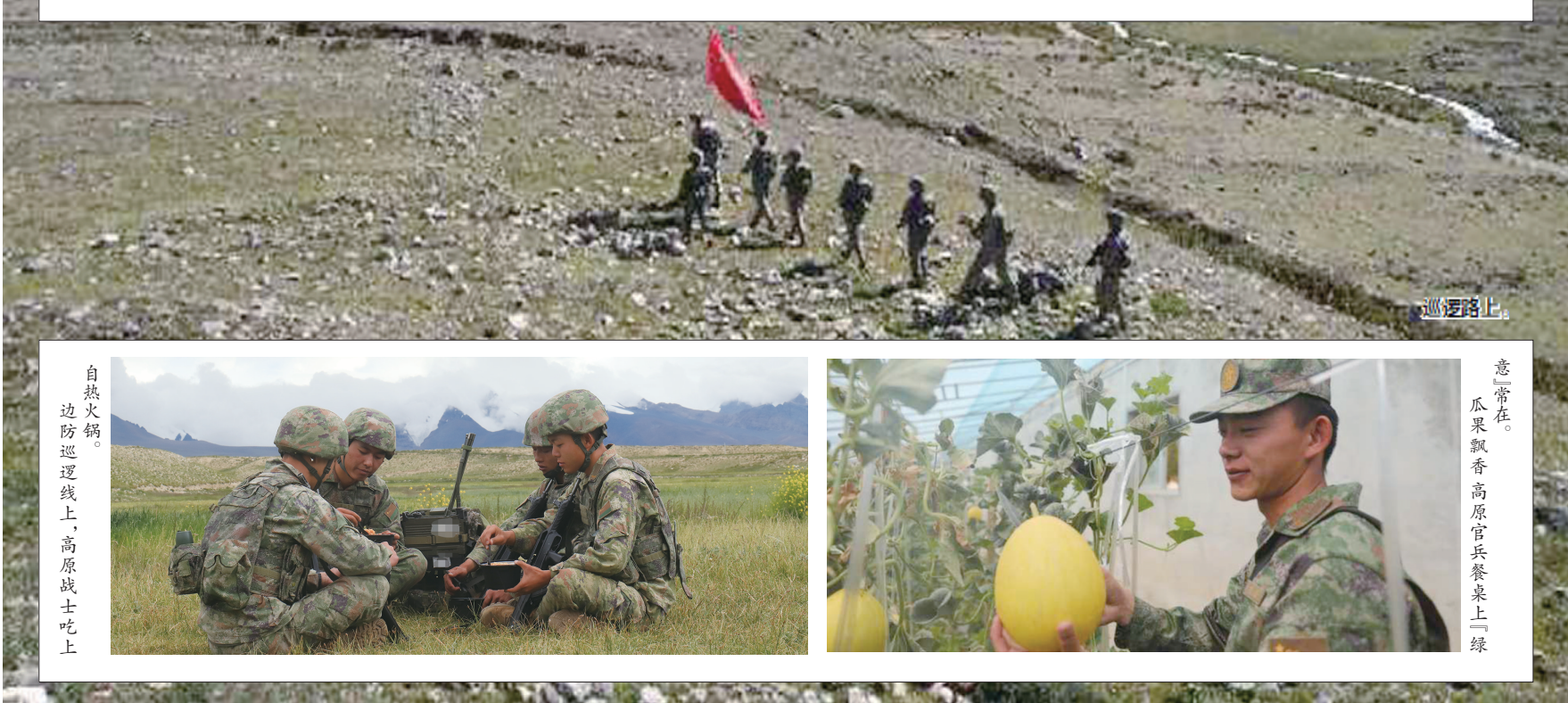
自热火锅。 边防巡逻线上，高原战士吃上