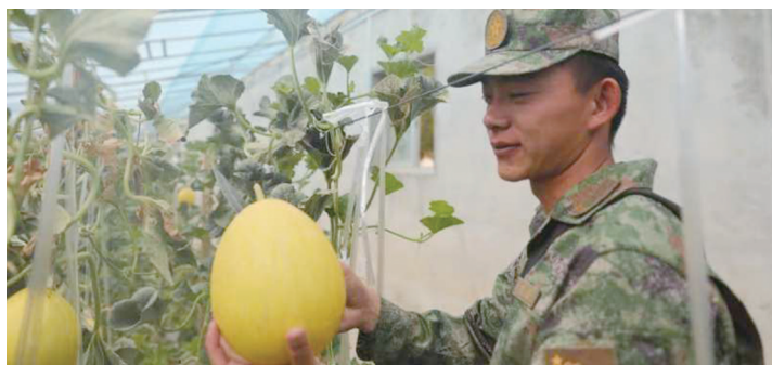
意「常在」。 瓜果飘香高原官兵餐桌上「绿