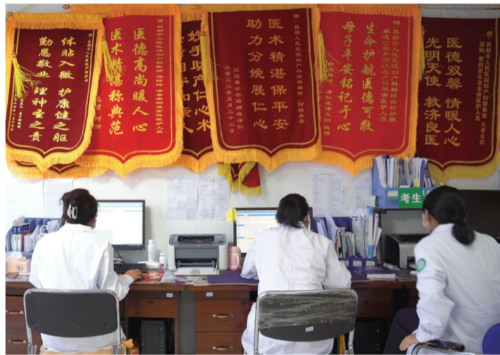
重庆市医疗援藏助力昌都市人民医院创建危重孕产妇救治中心。