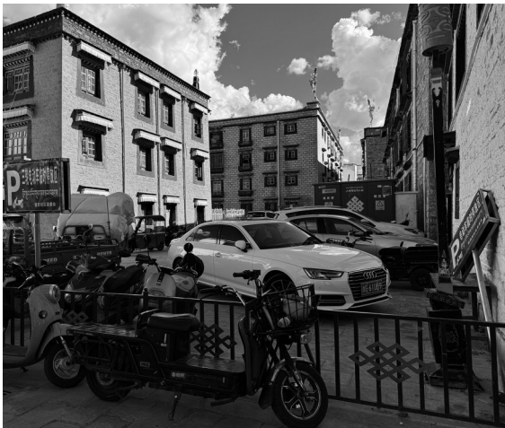
幼儿园门口电动车停车场内的违规停放车辆。

在拉萨古城的心脏地带， 翁堆兴卡路以其独特的韵味 穿梭于历史与现代之间，狭窄 的巷弄里藏着岁月的痕迹与 生活的烟火气。然而，近年 来，这条承载着古城记忆的小 巷却遭遇了一场“无声的战 役”——电动车乱停乱放问 题日益严峻，不仅影响了商 户的经营，更对居民的日常 出行安全构成了威胁。在这 场战役中，吉日居委会与铁 崩岗居委会多次尝试破解 难题。此次，记者将深入古 城巷陌，通过多立场深入采 访，揭示电动车乱停乱放的 现状、治理困境及背后的深 层思考。