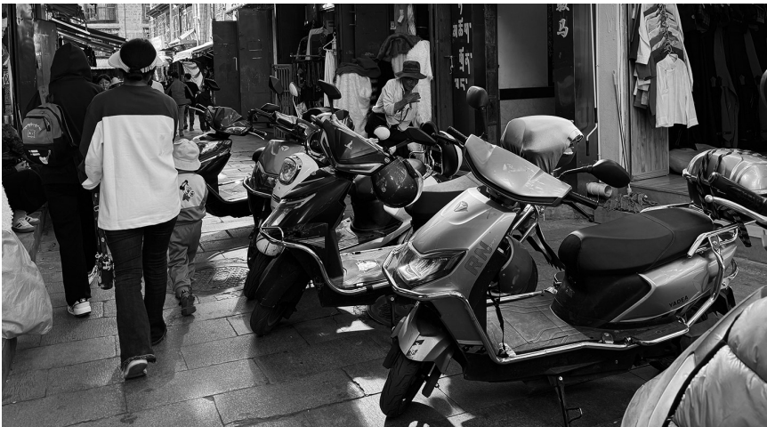
翁堆兴卡巷子内乱停乱放的电动车。